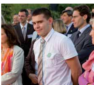
Grâce à un partenariat avec Sodexo, deux jeunes ont pu partir en CDD de 3 mois sur une plateforme pétrolière à Sakhaline. Une expérience unique ! En 2009, la destination retenue sera le Congo.

Depuis 2 ans, la Maison de l'Entreprise et de l'Emploi Arc de Seine met en place des actions internationales qui ont été développées avec les partenaires.